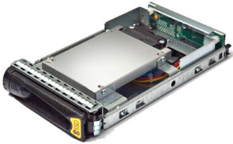
Abbildung 2. Ein Pillar SSD-Laufwerksrahmen.

Ein Problem bei der Verwendung von SSDs als Cache ist die Tatsache, dass die meisten Speichersysteme keinen Prozess besitzen, der verhindert, dass IOs mit geringerer Priorität die Cache-Ressourcen von denen mit höherer Priorität „stehlen“. Denken Sie zum Beispiel an ein Speichersystem, das eine Datenbank mit hoher Priorität unterstützt und zusätzlich für Backup-to-Disk verwendet wird. Wenn nun Backups laufen, verwenden die betreffenden IOs den Cache, und die IOs der Datenbank mit der höheren Priorität haben möglicherweise überhaupt nichts von der zusätzlichen Cache-Kapazität. Es ist daher viel effektiver, ein System zu kaufen, das bereits von Anfang an den erforderlichen Cache besitzt, und SSDs als Speicherkapazität einzusetzen.